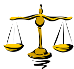
CAMERA PENALE DI AREZZO